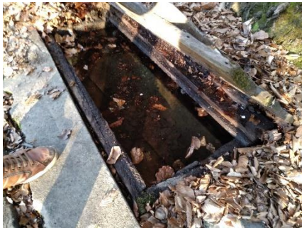
Alte Quelfassung/Brunnenstube 1

Situationen haben sie definitiv kein Wasser mehr und müssen eine neue Quelle fassen, was leichter gesagt als getan ist.