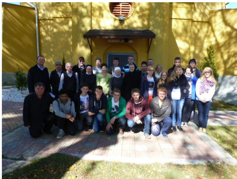
Teilnehmer erster Arbeitseinsatz